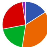
Figura 2 Pregunta 2 encuesta Salud digital