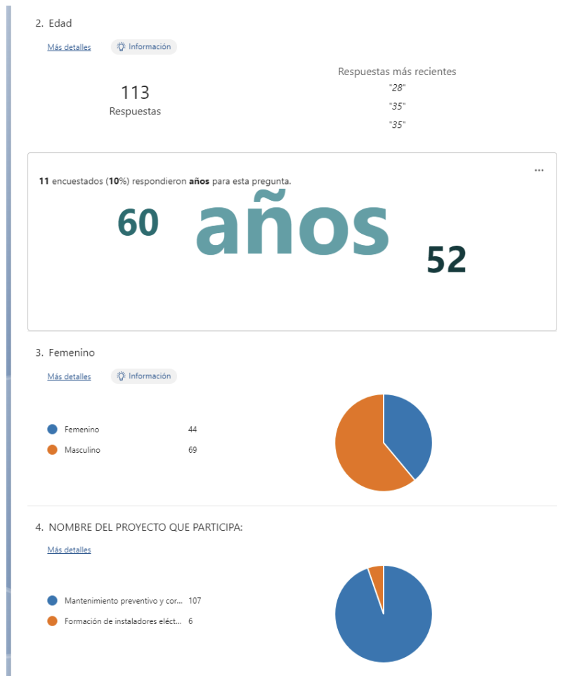
Figura 1 Evidencia de realización de encuesta

En los proyectos de Vinculación de la carrera de electricidad se tiene que: