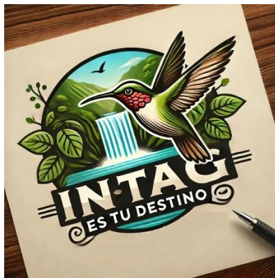
Autor: Carlos Andrés Vallejo V.

Para este proyecto utilizare el siguiente logo: